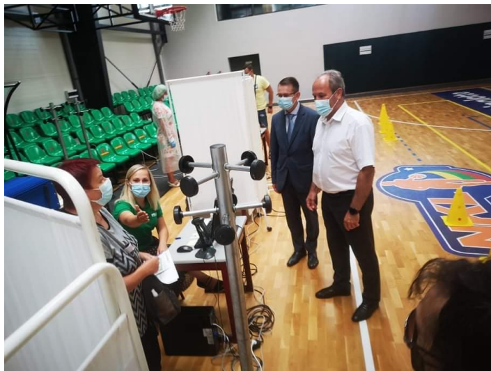
LR sveikatos apsaugos ministras Arūnas Dulkys ir Šilutės meras Vytautas Laurinaitis

Vakar (ketvirtadienį) Šilutės pirminės sveikatos priežiūros centro ir Šilutės rajono savivaldybės visuomenės sveikatos biuro vykdomoje vakcinacijoje nuo Covid-19 buvo atvykęs LR sveikatos apsaugos ministras Arūnas Dulkys, taip pat ir Šilutės meras Vytautas Laurinaitis.